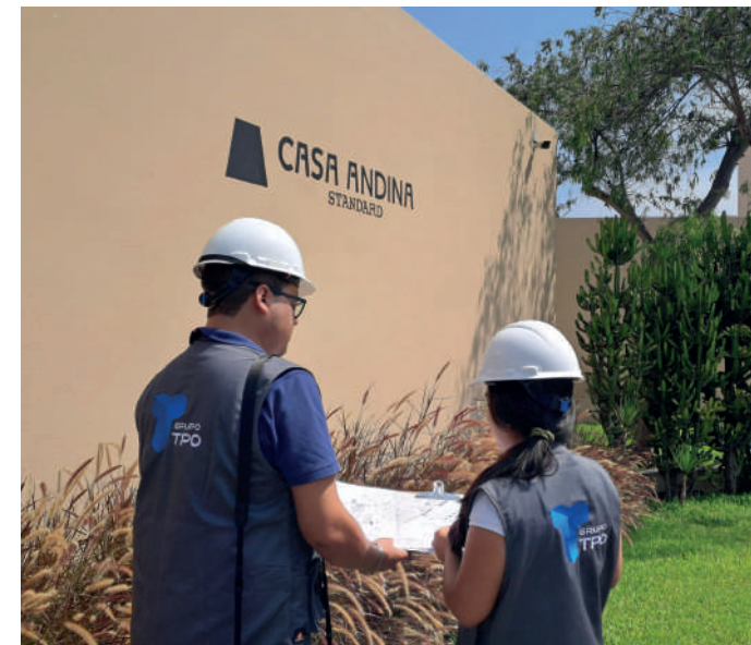
Asesoría y elaboración de expediente para ITSE - Hoteles Casa Andina