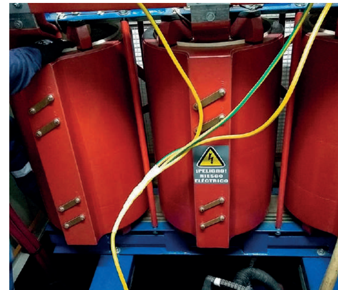
Subestación eléctrica en media tensión - Base Aérea Las Palmas