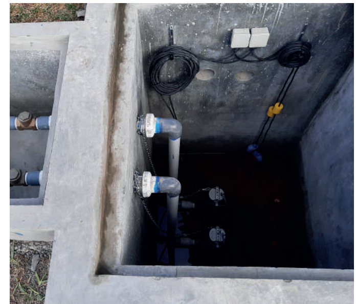
Red de desagüe con línea de impulsión - Universidad Científica del Sur - Sede Villa