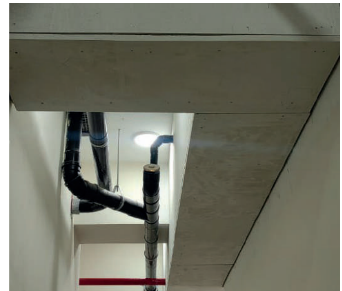
Compartimentación y sistemas cortafuego en escaleras de emergencia - Instituto SISE Santa Beatriz