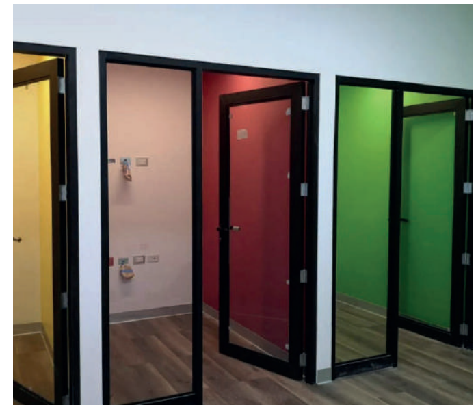
Laboratorios de TV y radio - Universidad Científica del Sur - Sede Villa