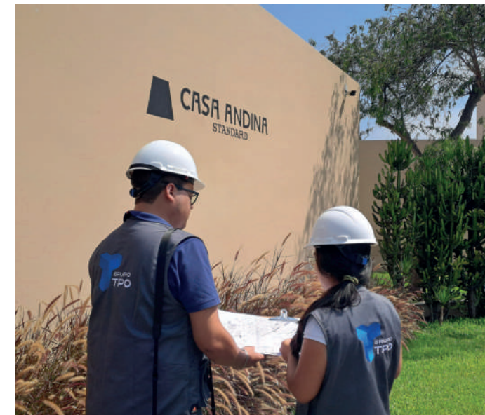
Asesoría y elaboración de expediente para ITSE - Hoteles Casa Andina