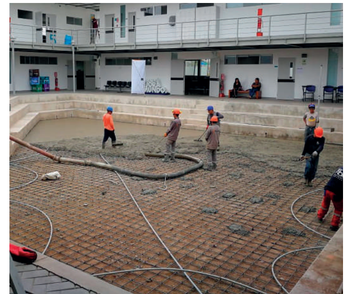
Pavimentación y asfaltado - Universidad Científica del Sur - Sede Villa