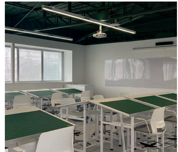
Aulas y talleres de Arquitectura - Universidad Científica del Sur - Sede Villa