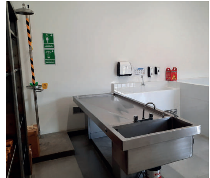
Laboratorios de Ciencias - Universidad Científica del Sur - Sede Ate